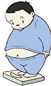
こんなはずじゃなかった!となる前に

そうは言っても健康に気を付けすぎて、せつかくのお正月を味気なく過ごすのももつたないのではほどに楽しんでください。皆様、楽しいお正月をお過ごしください。