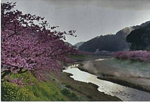
河津川沿いに河津桜が咲き並んでいる

は河津温泉郷があり、七滝温泉・大滝温泉・峰温泉などがあります。ここは伊豆の踊子のふる里としても有名ですね。見頃は二月上旬～三月上旬といわれています。