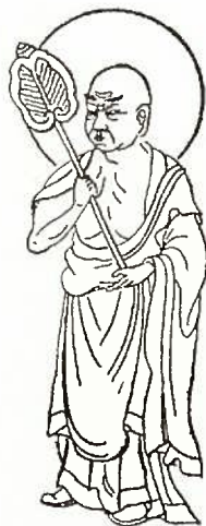
舍利子(シャーリープトラ)

光は一秒間に三〇万キロメートル、氷河は、一日に数十センチメートルの距離を進みます。横に移動できない植物は立体的に伸びます。すべて遅い速いの差はあつても移り変わらないものではありません。