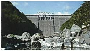
砂湯から見上げる湯原ダム