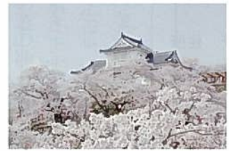
桜に囲まれる平山城

近くには湯原温泉郷があり、旭川の川床から湧き出す天然の露天風呂「砂湯」が特に有名です。77年に日本温泉協会が発表した露天風呂番付で「西の横綱」に選ばれるなどその実力は本物。高さ74メートルの湯原ダムの真下にあり、温泉に浸かつてダムを見上げるという光景のアンバランスさに驚くことでしょう。ちなみに川辺に石で囲ってあるだけなので、お湯は源泉かけ流し、無料で24時間入り放題です。