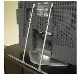
液晶テレビの転倒防止金具

テレビ台や、壁に固定する金具などがあります。背面に壁に固定するためのネジ穴が空いているのでテレビに穴をあけたり、接着剤を使う必要はありません。家の壁に穴を開けたくない方はテレビ台を検討してみたいかがでしょうか。