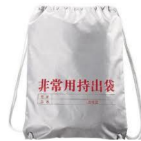
何をもっていきますか？

食料とは別に各自で用意しておく有効な物は、FMラジオ、懐中電灯(LEDがお勧め)、予備の電池、厚手のゴミ袋(水を貯める、廃棄物を入れる、防寒など多用途)、塩ビのラップ(保温、止血等に使い、塩ビのものは付きがよい)、筆記用具(水性ではな