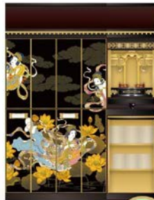
和 ~なごみ~ 2~9人用

家族壇 巾400 契約期間 永代 永代使用料 980,000円 年間管理料 9,800円