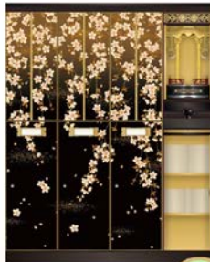
心 ~こころ~ 2~4人用

個別壇 巾400 契約期間 永代 永代使用料 298,000円 年間管理料 9,800円