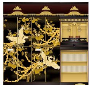
雅 ~みやび~ 2~15人用

家族壇 巾600 契約期間 永代 永代使用料 1,280,000円 年間管理料 9,800円