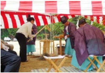
鍬入れの儀 「エイ！エイ！エイ！」

オープンまでの期間中は、現地ショールームにて納骨壇を展示しております。随時スタッフがご案内させていただきます。供養についても、ご相談もお受けしております。お気軽にお立ち寄りください。スタッフ一同お待ちしております。