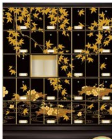
祈 ~いのり~ 1~2人用

太陽の塔 高天原ではご人数やご予算に合わせた4種類の時絵入納骨壇をご用意いたしました