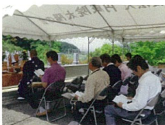
第2 西大寺太陽霊園