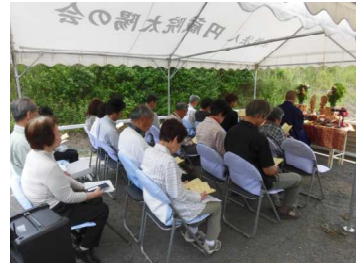
第二西大寺太陽霊