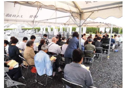
コスモガーデン倉敷