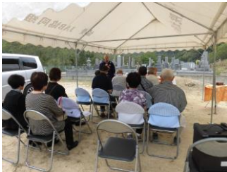
令和元年 9 月 28 日