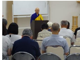
令和元年 8 月 11 日・12 日