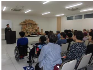
令和元年 9 月 21 日・22 日