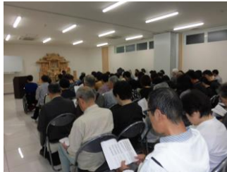
高天原秋彼岸法要