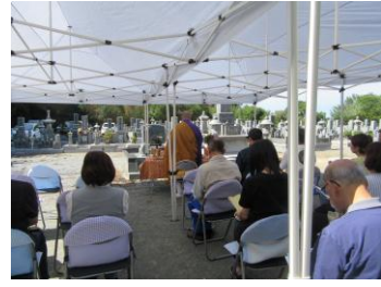
北神戸太陽霊園 令和6年10月6日(日)