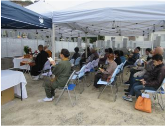
児島太陽霊園 令和6年10月19日(土)