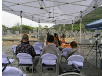
海田太陽霊園 令和6年11月16日(土)